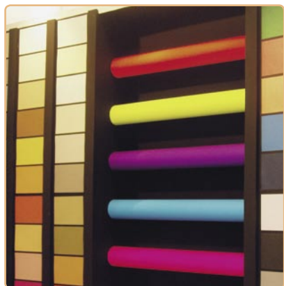
Luxcent Cores é fabricada no Brasil

Um exemplo é a VSP, que lançou, durante a feira, uma linha para embalagens, capas, convites, cartões, brochuras, caixas artesanais, entre outras aplicações. Trata-se da linha Luxcent Cores.