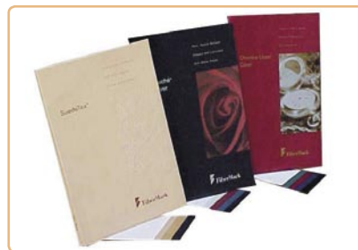
Da esq. para a dir.: catálogo das linhas Suedetex, Touché Cover e Cheshire Linen Cover da VIP Papers

Com relação a série Suedetex, a empresa afirma que o diferencial é a textura que simula camurça. Os papéis podem ser encontrados no tamanho 1.016 X 660 mm, nas gramaturas 252 e 431 g/m 2 e nas cores creme, preto e dois tons de marrom.