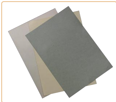
As linhas Evenglow Opalina e as cores metálicas do Color Plus são fabricadas na Argentina e as inclusões da Curious Collection vieram da Inglaterra

Cláudia informou que a Color Plus tem três novas referências metálicas em 120 e 250 g/m 2 , no formato 650 X 950 mm. Elas estão disponíveis nas cores branco (Aspen), creme (Majorca) e cinza (Mar del Plata). Na linha Curious Mettals, a novidade é o Hades, papel preto com brilho