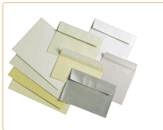
Os papéis importados são fabricados na França, Inglaterra, Escócia, entre outros países

A VSP também realizou o pré-lançamento da linha Scents durante a “Fiepag” e o lançamento oficial na “Luxe Pack”.