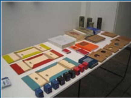
Material produzido pelos jovens atendidos pelo projeto