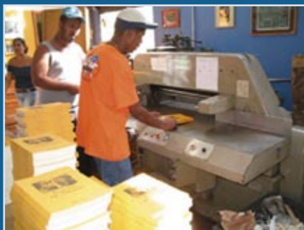
Mais de 500 adolescentes já foram atendidos pelo projeto