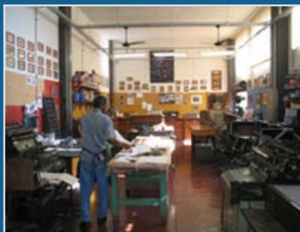
Local cedido pela Secretaria de Estado da Justiça e dos Direitos Humanos, onde funciona o Memória Gráfica

Técnicas de encadernação como costura manual, por caderno e simples, espiral, peças gráficas coladas, grampeadas e picotadas, douração e marmorização também são ensinadas.