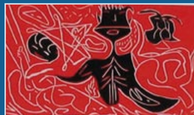
Gravura produzida pelo participante Marco Aurélio Miranda